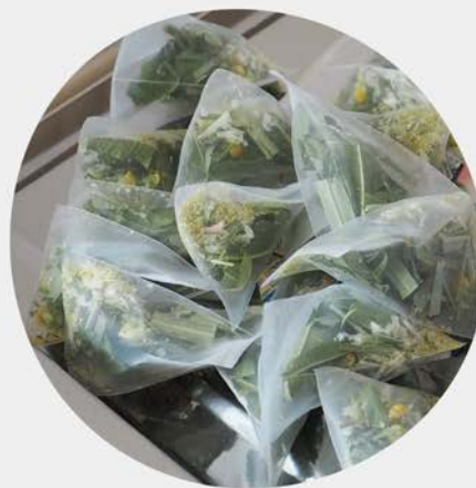
ティーバッグ加工