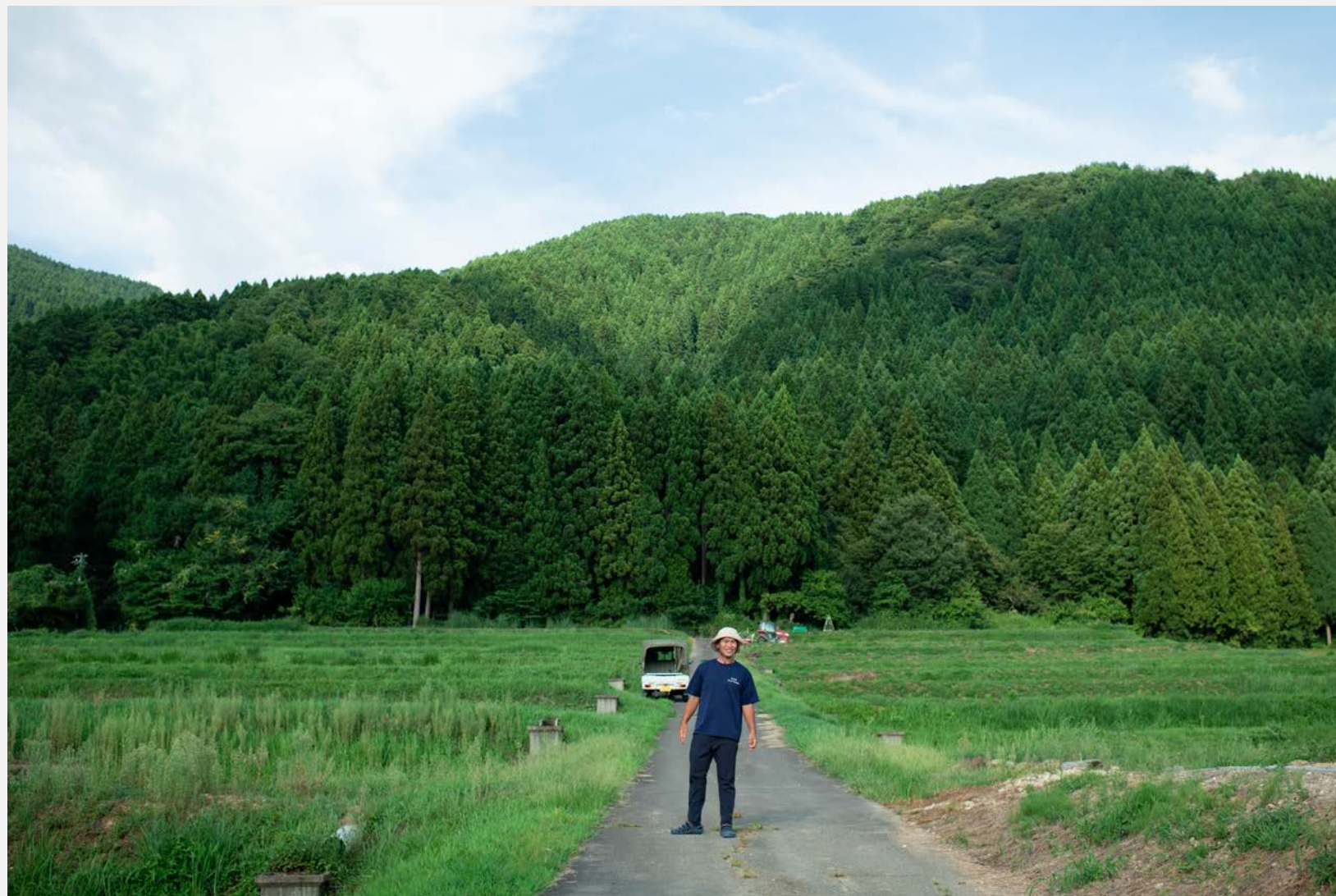
山側（白山市）約1haの圃場